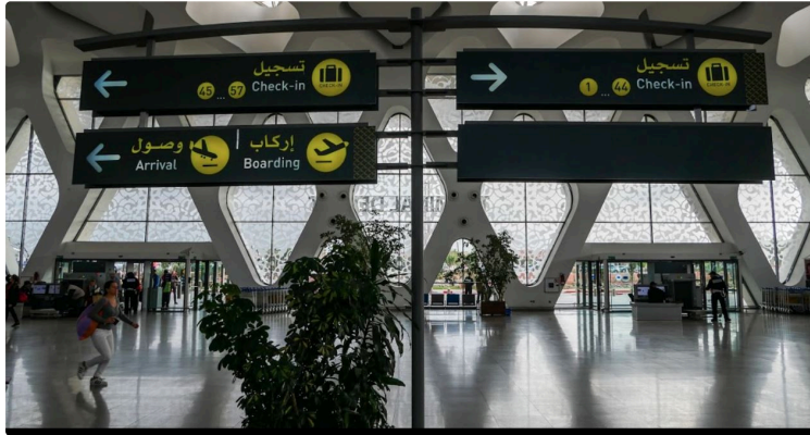
Confiné au Maroc : Un couple de Gersois prend son mal en patience