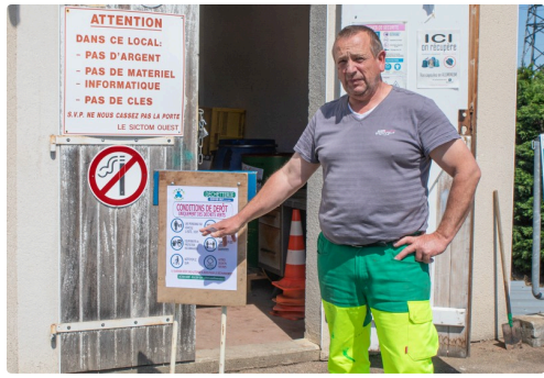
Le gardien de la déchetterie de Nogaro montre les consignes