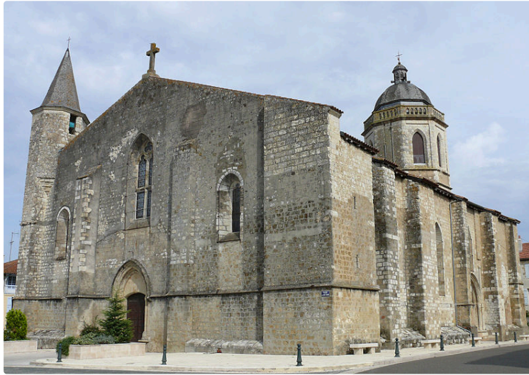
Lien des paroisses catholiques Ste Fauste du Fezensac et St Pierre de Barran Jegun spécial confinement