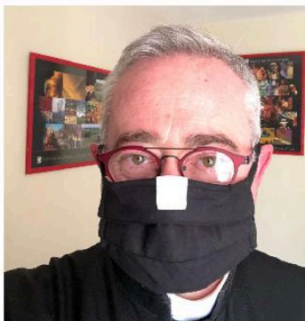
M. le Curé aussi porte un masque !

P.S. Si vous avez besoin de quoi que ce soit n'hésitez pas à téléphoner au presbytère et à laisser un message.