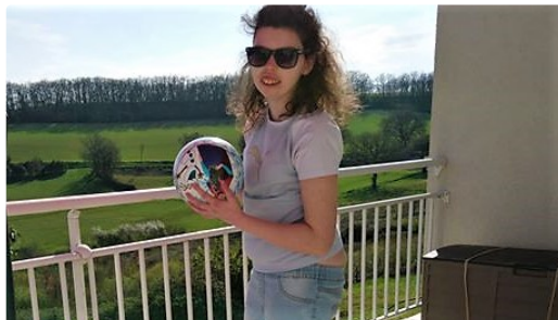
Vivre confiné avec le syndrome de Dravet

Un combat épuisant, à mener sur plusieurs fronts