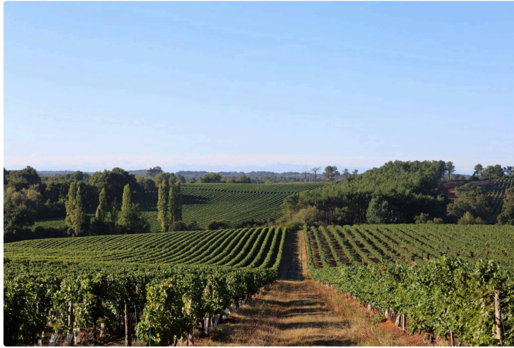
Ces paysages qui nous rapprochent...