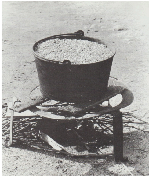
La préparation du maïs