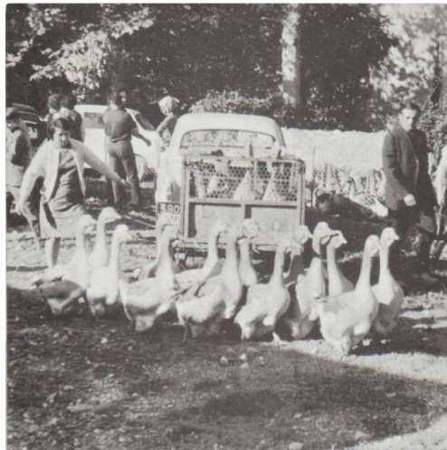
Le marché aux oies maigres