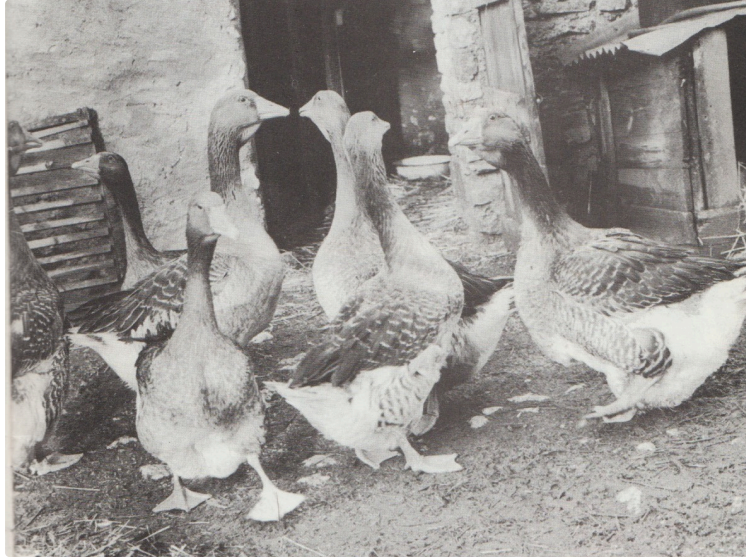
Le gavage des oies à l'ancienne

Les vacances approchent et nous ne savons pas encore comment elles se dérouleront en cette période sensible.