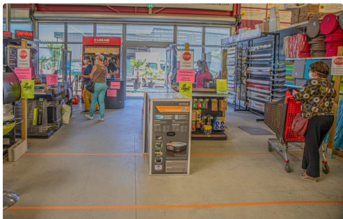
La sortie vers les 2 caisses