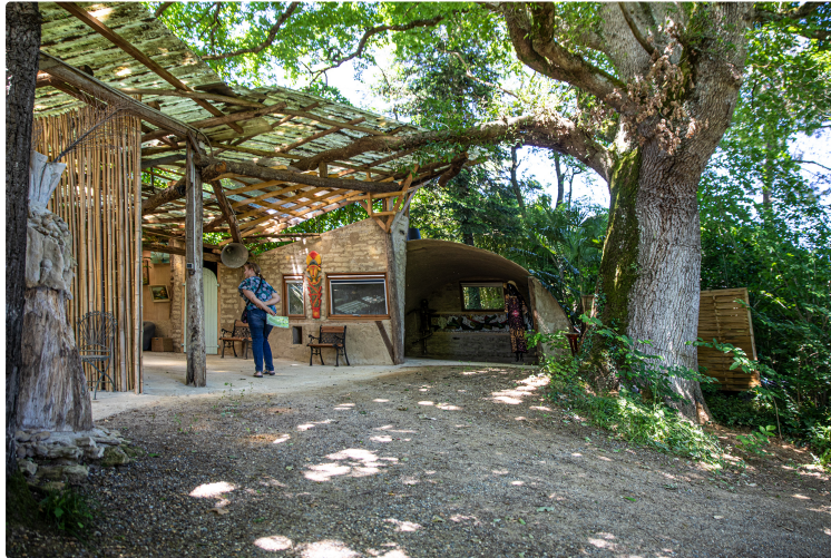
1re promenade enchanteresse dans la Palmeraie de Bétous

Un assemblage équilibré d'exotisme et de nature gersoise