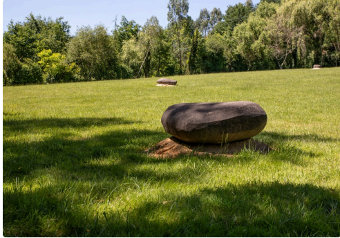
D'énormes galets ponctuent les espaces libres