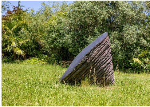
Une toupie géante