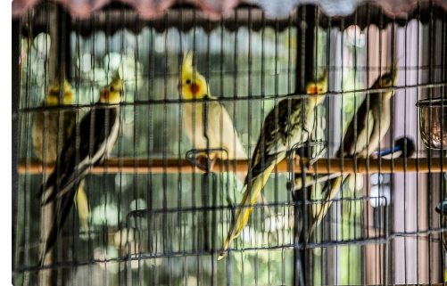
Des perruches en attente d'une grande volière en construction à l'extérieur