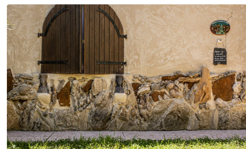
Bas-relief avec les roches trouvées dans le jardin