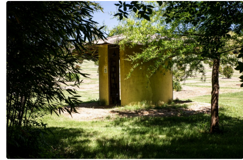
La bibliothèque aux champs