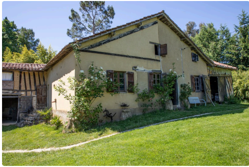
La ferme avec meubles anciens et salle d'expo