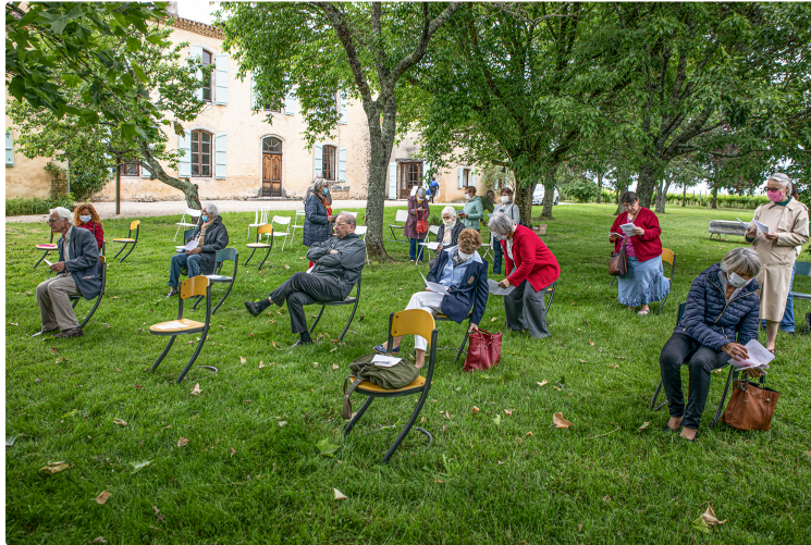
Messe en plein air près de Manciet

Mais la Pentecôte aura lieu dans les églises