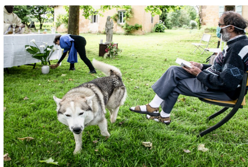
Le chien Athos vérifie les mesures sanitaires