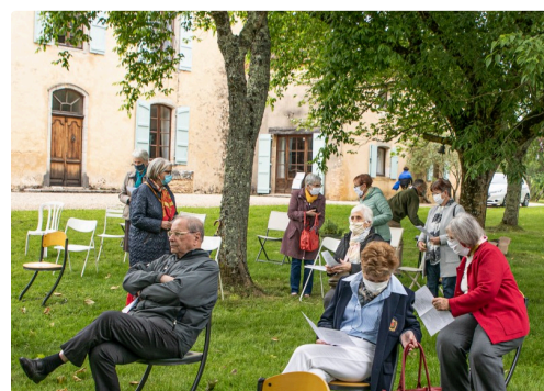
Les fidèles s'installent

L'abbé a annoncé que la messe de la Pentecôte, le dimanche 31 mai, aurait lieu dans l'église de Nogaro à 9 heures et dans l'église d'Aignan à 11 heures. Comme, le nombre de personnes entrant dans une église ne doit pas dépasser 100, il n'est pas exclu qu'une troisième messe s'intercale entre les deux horaires précités.