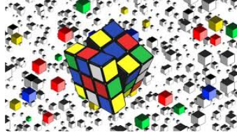
Solution des jeux du week-end !