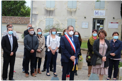
Moment de recueillement des conseillers municipaux devant la stèle du 19 mars.