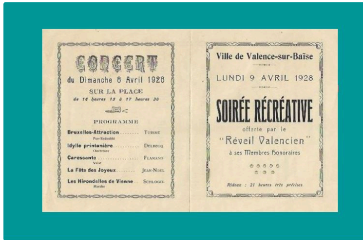
Demandez le programme !

De tous temps, il en existait. Voici les flyers du Réveil Valencien de l'époque !