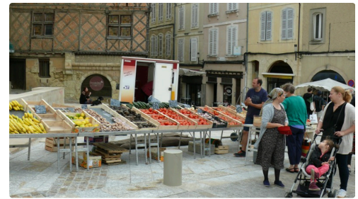
Fruits et légumes en "plein-vent".