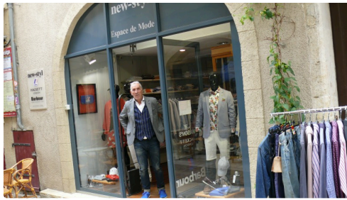
New-Styl, espace de mode : les bonnes habitudes se mettent en place.