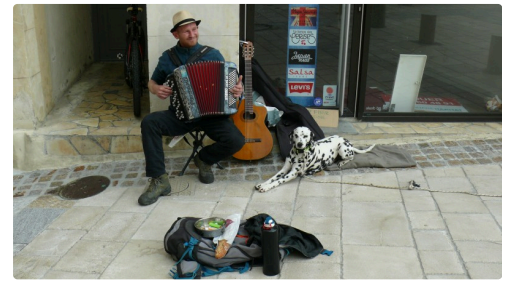
Un petit air d'accordéon, ce samedi, jour de marché.