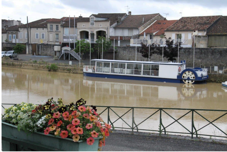
De nouveau à flot !

Le D'Artagnan a retrouvé son milieu naturel : les eaux de la Baïse