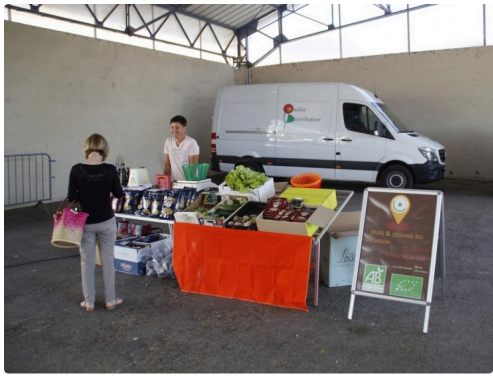
Le stand Onélia sur le marché de Miélan