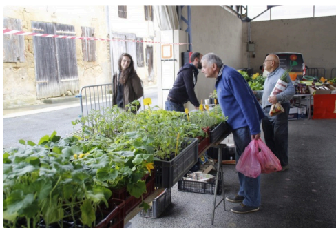
Mr et Mme Vignolo pour des plants de légumes