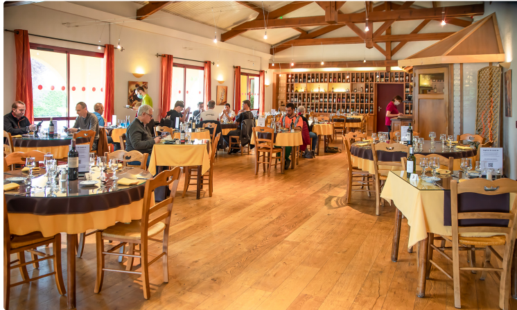
Une pépite du tourisme armagnacais à Nogaro a rouvert

Le Solenca : restaurant classique, drive et hôtel***