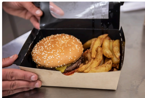
Gros plan sur ce colis