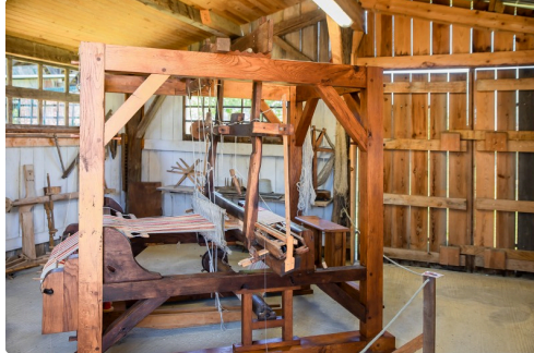
Métier à tisser du XVIIe siècle (en fonctionnement)