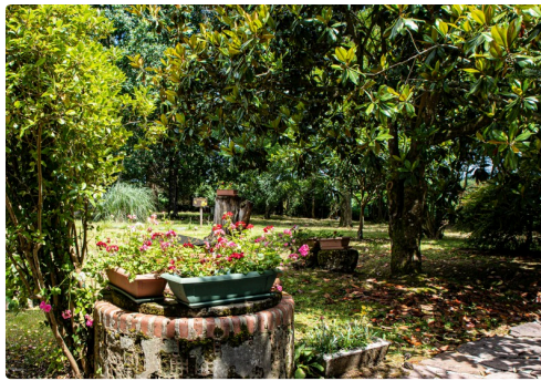
Le vaste parc ombragé de la maison Lacaze