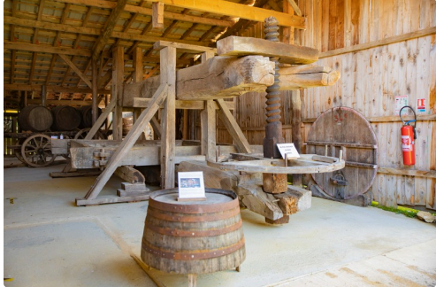
Enorme presseur à taissons du XVIIe siècle