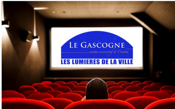
Les lumières de la ville vont à nouveau éclairer Le Gascogne !

Après trois mois sans programmation, l'écran du cinéma condomois va s'animer à nouveau