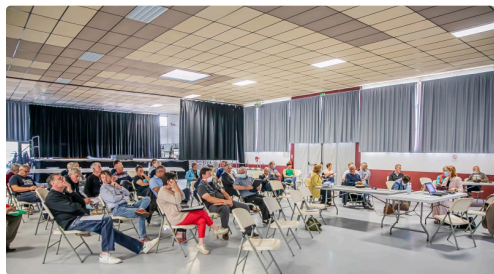
Le conseil de la CCAA réuni dans la halle de Riscle

(1) Schéma de cohérence territoriale. (2) Plan local d'urbanisme intercommunal. (3) EHPAD : établissement d'hébergement pour personnes âgées dépendantes ; CIAS : Centre intercommunal d'action sociale ; SSIAD : Services de soins infirmiers à domicile.