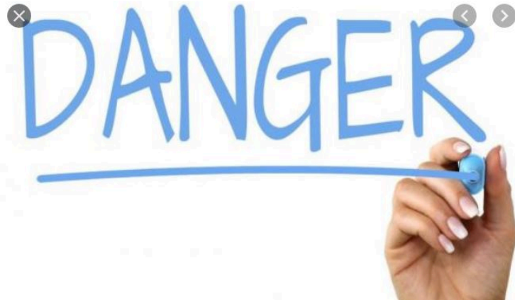
Alerte : produits retirés du circuit commercial

Certains produits de consommation courante peuvent présenter des risques pour la santé ou la sécurité des personnes, en raison d'un défaut de conception ou de fabrication, ou de la défaillance de certaines pièces. Lorsque un risque est détecté après la mise sur le marché, le produit doit être retiré de la vente, ou rappelé s'il a déjà été vendu.