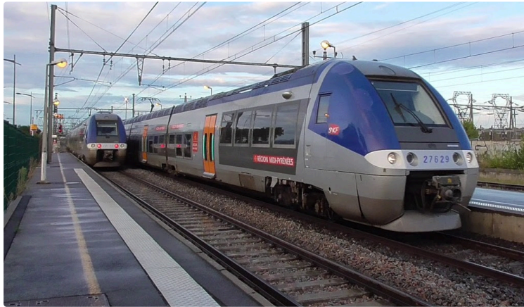
Toujours des billets de train à 1€ pour aller à Toulouse ou à la plage cet été

Nous avons testé la billetterie TER en ligne. De nombreux parcours Auch-Toulouse et même jusqu'aux plages de la méditerranée sont proposés à 1€.