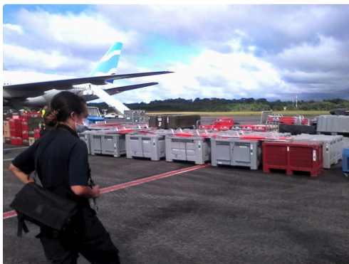
pompiers guyanne 3.jpg

Annick Girardin, la ministre des outre-mer, a annoncé mardi l'arrivée de renforts de la réserve sanitaire et de l'assistance publique des hôpitaux de Paris (AP-HP), de 15 respirateurs, de matériel de l'hôpital de campagne projetable de la sécurité civile française (Escrim) pour les patients non Covid, ainsi que la mise à disposition de dexaméthasone – traitement qui réduirait d'un tiers la mortalité chez les malades les plus gravement atteints.