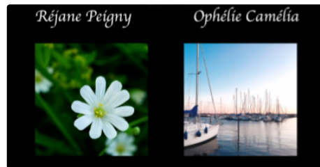
« Ici et là »

Une exposition proposée par LALO association à la médiathèque