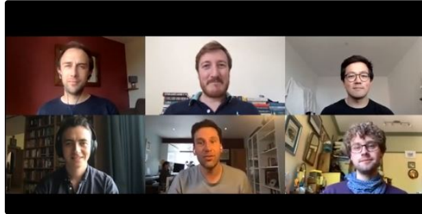
Eclats de Voix : deux concerts sauvés de la programmation du 23e Festival

La réservation est ouverte, ne tardez pas !