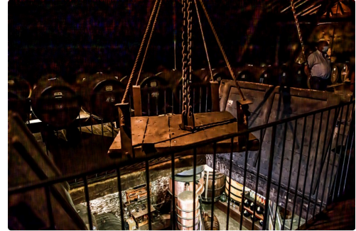
Chai de vieillissement et monte-charge