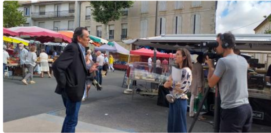
Sur les traces du film "le bonheur est dans le pré"...

25 ans après le tournage du film, caméras et micros étaient de retour à Vic-Fezensac.