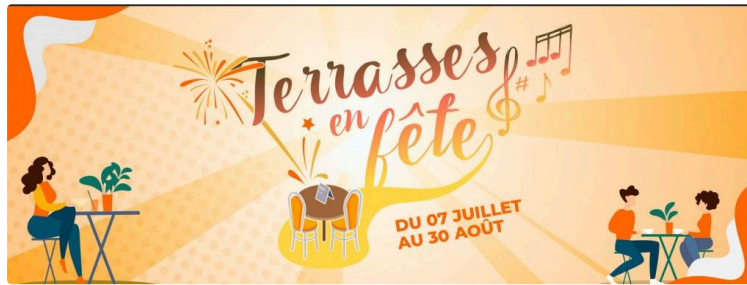
Les Terrasses en Fête

La Mairie de Mirande en partenariat avec l'Office Mirandais d'Animation met en place cette année le projet de TERRASSES EN FÊTE !!