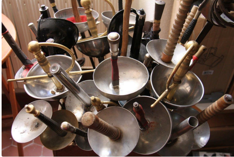
Plus une minute à perdre, cette année !

Le Covid est toujours là et, à cause de lui, les places seront limitées. Amateurs de théâtre et incondtionnels de la Boîte à jouer, précipitez-vous, la billetterie est ouverte !