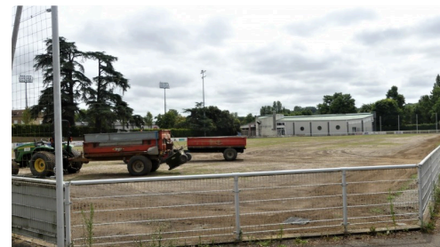
Stade Éric Carrière