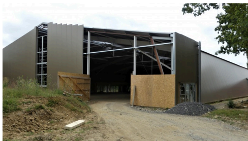
Salle Ernest Vila