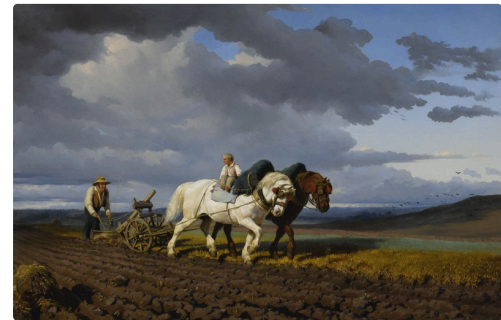
Le labourage de Rosa Bonheur , 1845