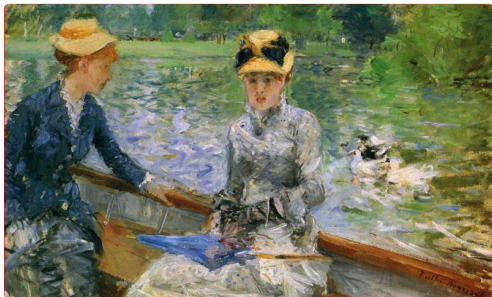
Journée d'été de Berthe Morisot 1879