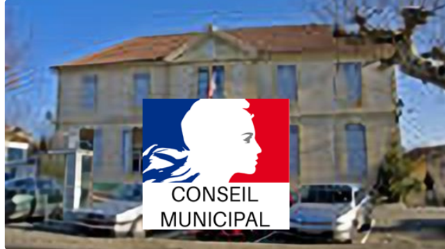
Pavie: Conseil municipal avant les vacances