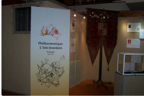
Philharmonie de l'Isle-Jourdain 005.JPG