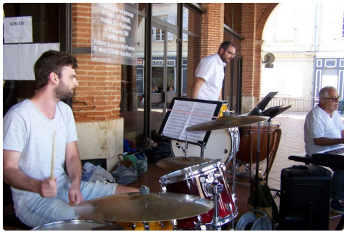
Philharmonie de l'Isle-Jourdain 014.JPG