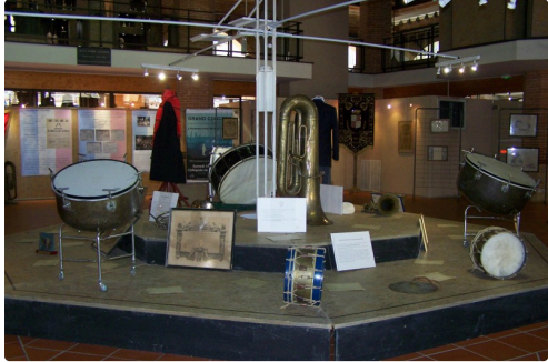
A l'intérieur, exposition des instruments