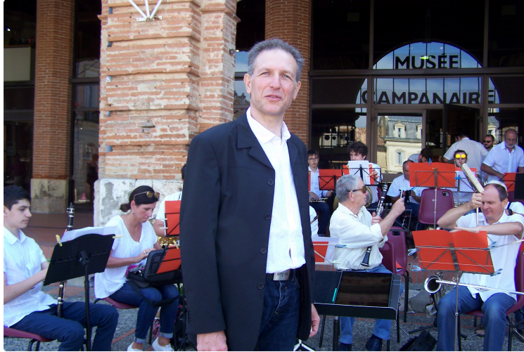
La Société Philharmonique de l'Isle-Jourdain expose tout l'été pour ses 180 ans