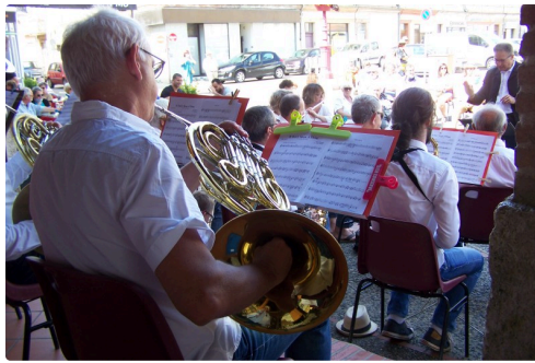
Philharmonie de l'Isle-Jourdain 015.JPG