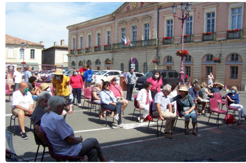
Philharmonie de l'Isle-Jourdain 010.JPG