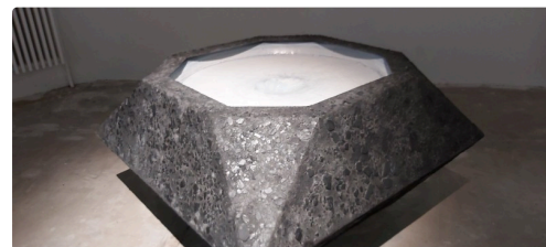
"Kyklos " de Charlotte Charbonnel