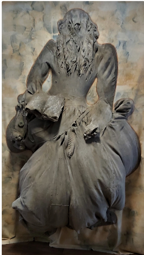
"Ken burns" de Ken Sortais

Petit aperçu ci-dessous, pour le reste, Memento vous attend.