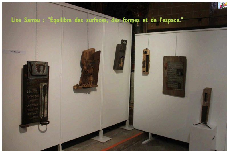
Lise Sarrou : "Équilibre des surfaces, des formes et de l'espace."