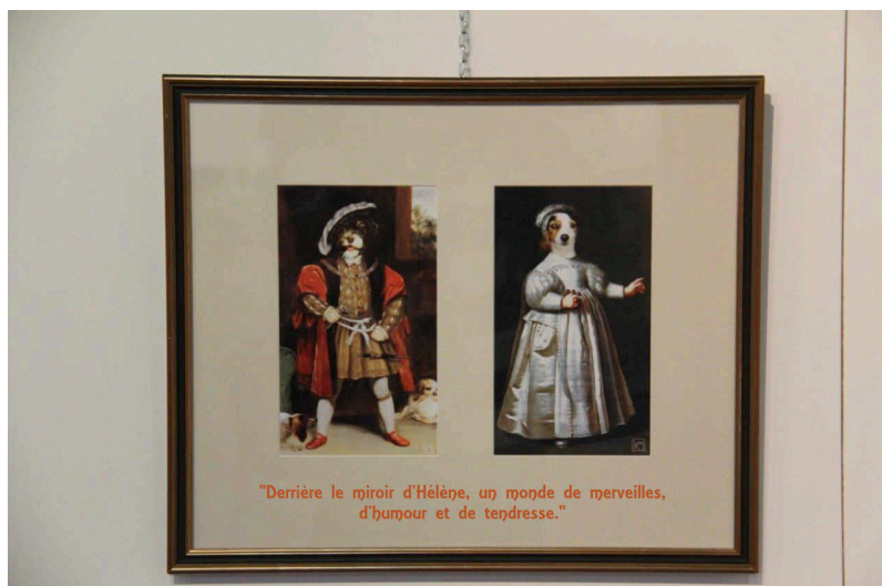
"Derrière le miroir d'Hélène, un monde de merveilles, d'humour et de tendresse."