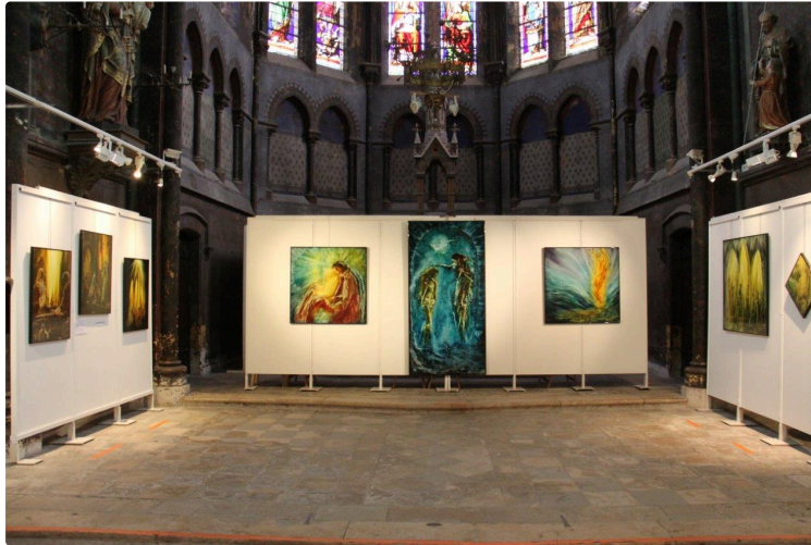
Sept artistes s'installent pour trois semaines à l'Espace Saint-Michel