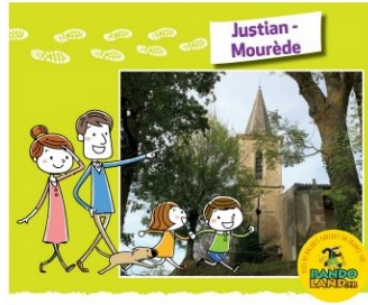
La randonnée de la semaine : Randoland à Justian et Mourède

Vendredi, l'Office de Tourisme d'Artagnan en Fezensac et la commune de Justian vous proposent une séance de cinéma gratuite en plein air à 22 h (voir notre article de samedi 25 juillet).