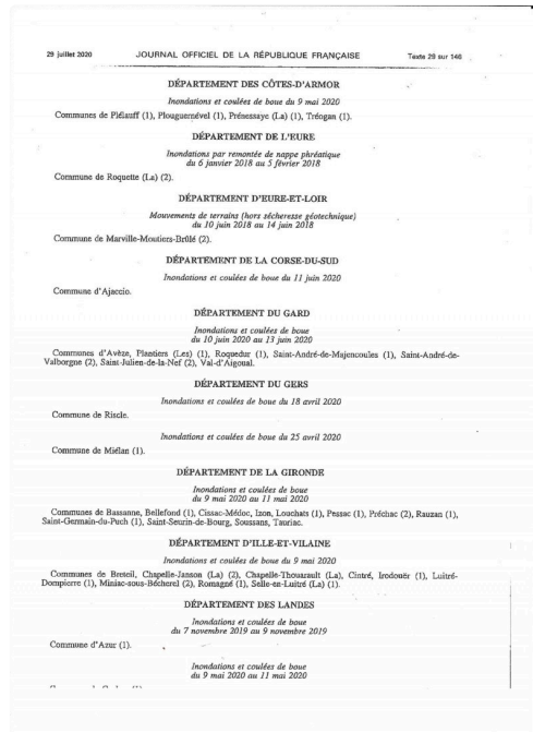
Arrêté 6 juillet 2020 Cat Nat (2).jpg