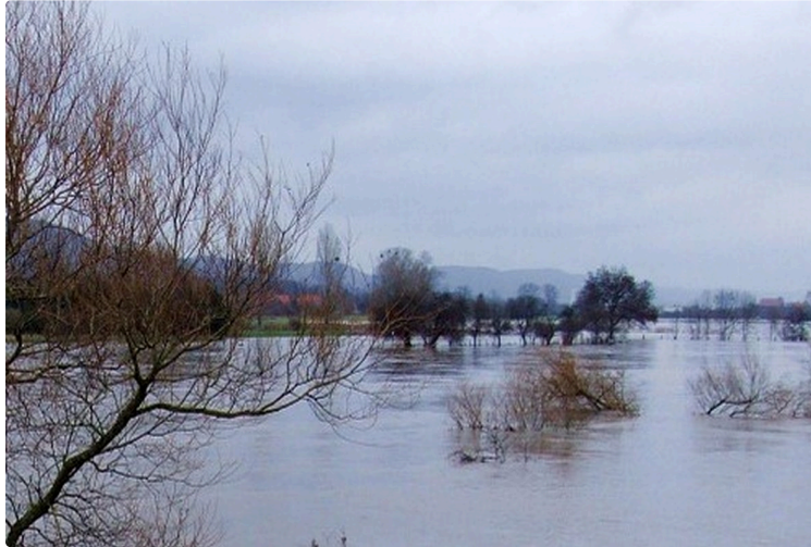
Le maire de Miélan communique

L'arrêté du 06 juillet 2020 portant reconnaissance de l'état de catastrophe naturelle pour les inondations et coulées de boue du 25 avril 2020, est paru, ce jour, au Journal Officiel.