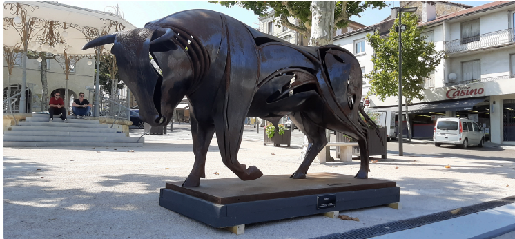
Urus veille sur Vic !