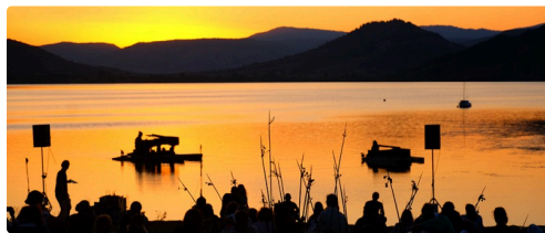
2 DR site Piano du lac.jpg