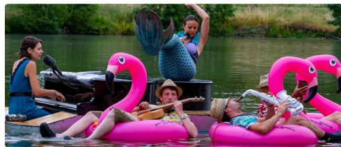
3 DR site Piano du lac.jpg