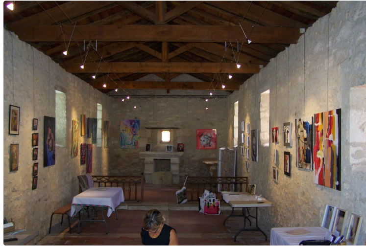
Partage de couleurs à la petite chapelle de Sarrant

C'est l'été de la culture artistique qui est partout dans le Gers, ici comme ailleurs, dans ce beau village typique, l'art est au rendez-vous estival, plusieurs expositions se suivent.. de belles balades en perspective !