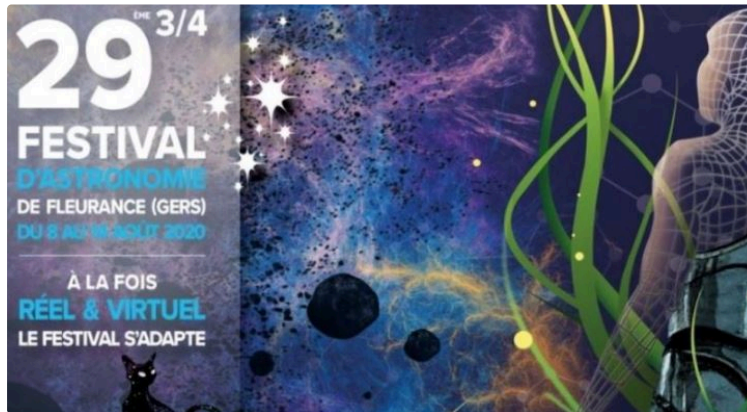
Festival d'astronomie de Fleurance réinventé en réalité virtuelle de près ou de loin.

Vendredi 7 ce sera la 29ème édition 3/4 du festival qui brave la morosité et l'isolement et propose un enchaînement sur mesure entre présence et à distance.