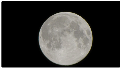
La course aux planètes, la tête dans les étoiles.

Pourquoi le 29ème 3/4 ? Demandez à Harry Potter. Mais c'est un passage obligé..