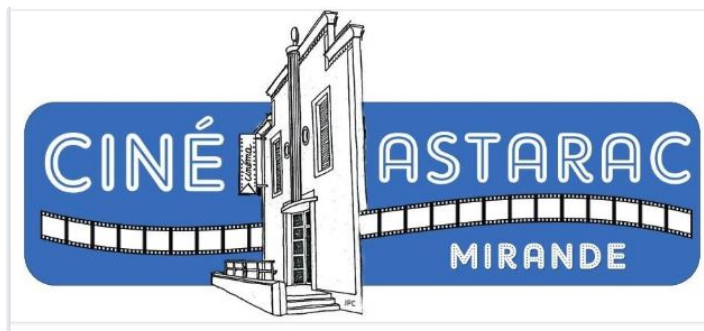
Le Ciné Astarac part en vacances

Fermeture annuelle du 12 août au 1er septembre. L'équipe du Ciné-Astarac vous souhaite de bonnes vacances et vous donne rendez vous pour la prochaine saison cinématographique le 2 septembre.