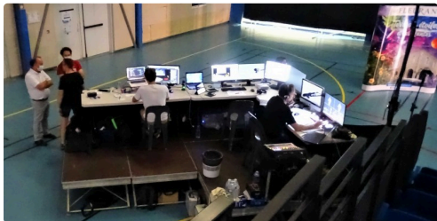
Un plateau technique comme ça ne s'improvise pas.

https://www.festival-astronomie.com/nous-soutenir .