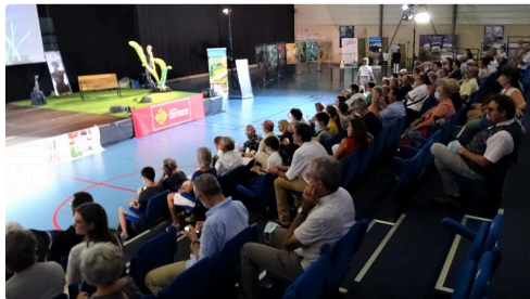
Le public de fidèles était là même limité compte tenu de la situation.