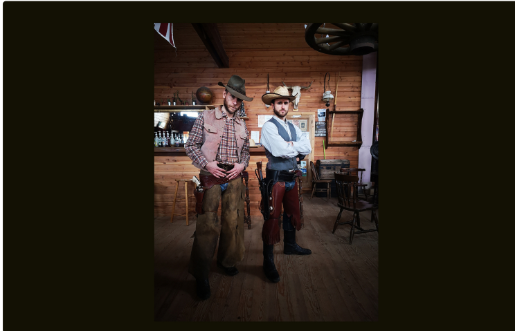
Participer au financement d'un western français à Carchet City (Aignan)

L'équipe de tournage a besoin de 16 000 euros