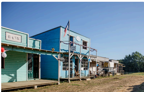
Suite de la rue - Photo Roland Houdaille