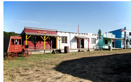
Un côté de la rue à Carchet City