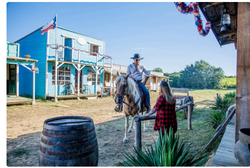
La vie quotidienne à Carchet City