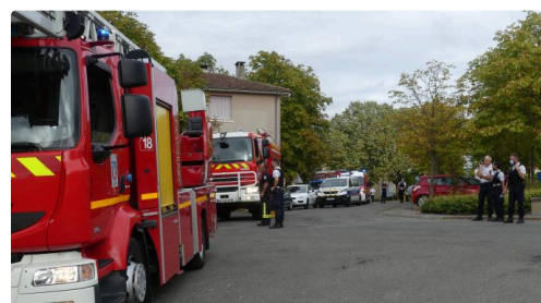
Forte mobilisation des secours

AUCH - Mercredi en soirée, aux alentours de 22 h 50, la cabine de production d'un food-truck, qui circulait chemin de Monlaur, s'est partagée en deux, avant de tomber sur la chaussée. Heureusement sans faire de blessé.