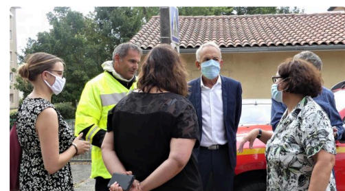
les autorités font le point