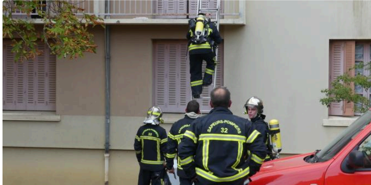
Faits divers : Explosion à Auch

AUCH - Peu avant 18 heures une forte déflagration s'est produite au 6 de la rue du 88 ème à Auch (quartier de la Hourre) dans un appartement situé au premier étage. Plusieurs appartements voisins ont vu leurs vitres voler en éclat.