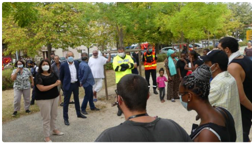
Information aux habitants