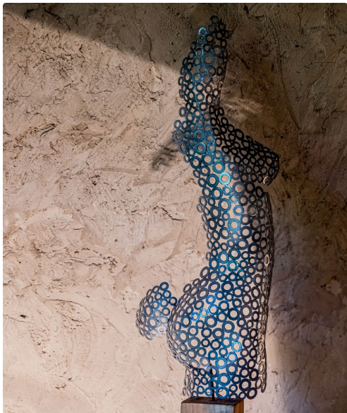
Profil de femme