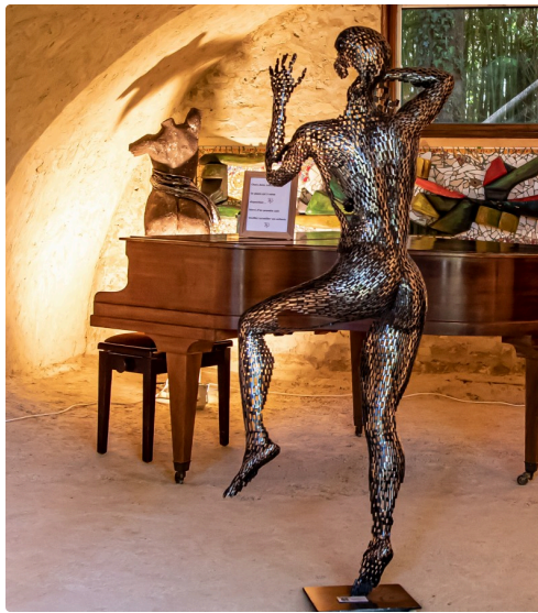
Silhouette de femme