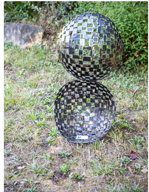
Boule ouverte où l'on voit la précision du travail