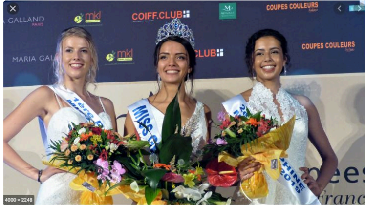
Le grand jour approche pour l'élection « Miss Gers 2020 »

Malgré les contraintes et les incertitudes pesant sur la manifestation, Karine Dariès a tenu, dès les premières mesures sanitaires annoncées, à maintenir cette tradition sur le département. Initialement prévu pour le 4 juillet, rapidement des dispositions ont été prises, des solutions trouvées, ainsi le Gers est resté présent pour les futures compétitions régionales et nationales des Miss.