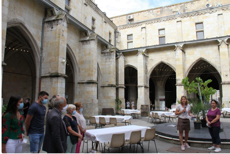
Le sport et le vin ne sont pas forcément incompatibles !

La preuve : le Judo Club de Condom organise une Foire aux vins, ce week-end