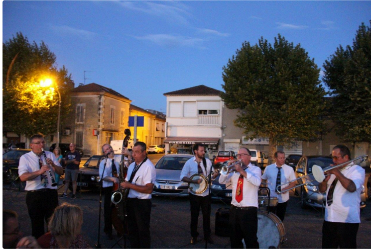
L'été culturel 2020 touche à sa fin

Dernier Jeudi Food Truck dont l'équipe municipale précédente avait pris en charge l'animation musicale