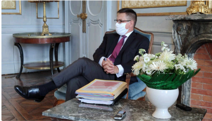
Rencontre avec le nouveau préfet du Gers