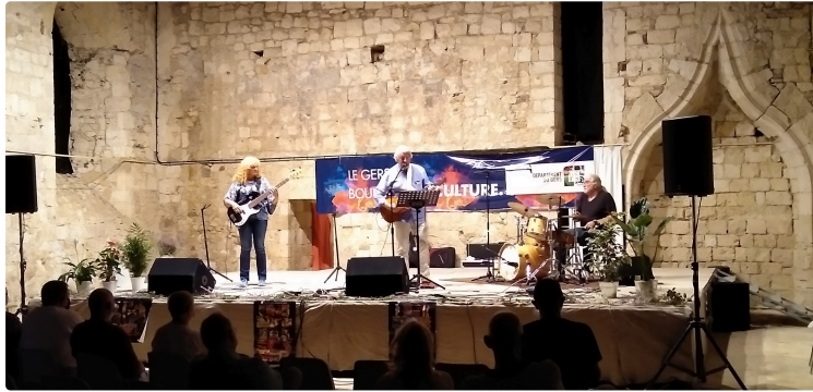
Soirée Polyphonies Corses à la vieille église